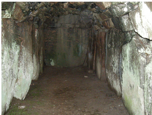
Hällkistan på insidan.

Materialet sammanställt av Lena Calmestrand