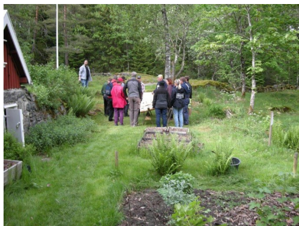
Kurs i spånläggning på Kulla.